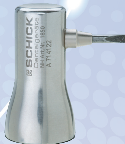
リベッティングハンマー チゼル 1850/1