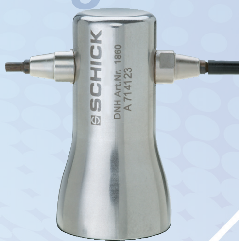
リベッティングハンマー ツイン 1860