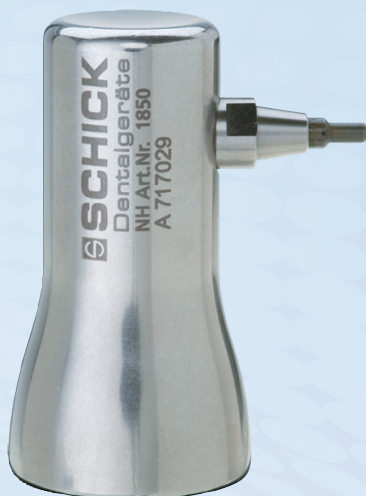
リベッティングハンマー ノーマル 1850