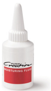
モイスタリングフルード