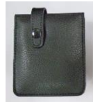
バッテリーパック用ケース (ベルトホルダ付き)