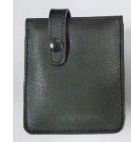
バッテリーパック用ケース (ベルトホルダ付)