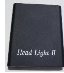
バッテリーパック