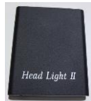
バッテリーパック