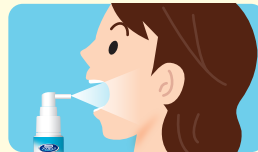
液が広がりやすい