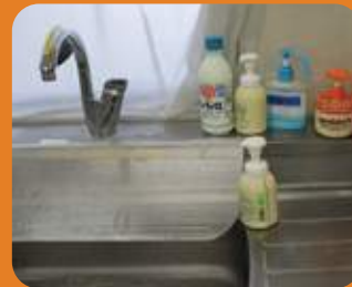
※写真は旧仕様ポンプ（ユースキン A260g）

ユースキンは、医療現場における手指衛生のための CDC ガイドラインに示されている「手指消毒剤（※1）の殺菌効果を阻害しないこと」「医療現場で使用する手袋（※2）の強度に影響を及ぼさないこと」を確認しています。