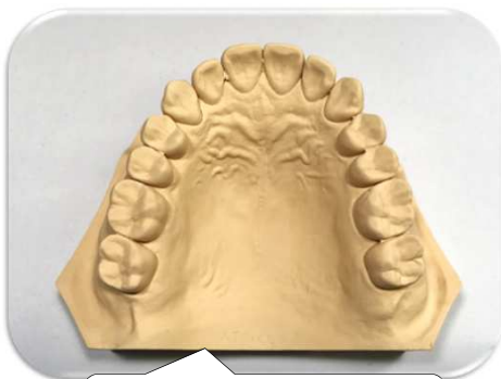
作業用模型の作製