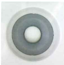
特殊加工超音波振動子

※お客様にて部品の交換はできません。お買い求めの販売店までご連絡ください。(有料)