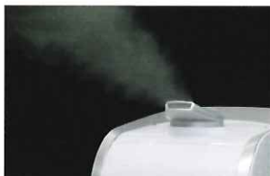
霧が良く飛び吹出口

電源ONですぐに霧が発生し、効率よく次亜塩素酸ナトリウムを放出、室内の除菌・消臭ができます。また 噴霧する霧は熱くない のでお子様やお年寄りがうっかり触ってしまってもヤケドの心配がなく、どなたにも安心してお使いいただけます。