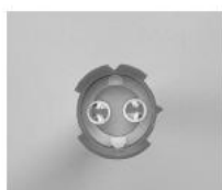
ミキシングチップII