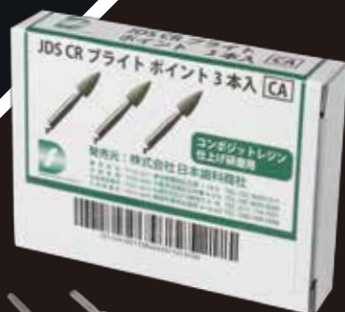
JDS CRブライツ ポイント 包装:3本 価格 2,500円