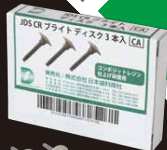
JDS CRブライツ ディスク 包装:3本 価格 2,700円