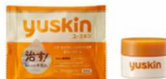
ユースキン 4g サンプル