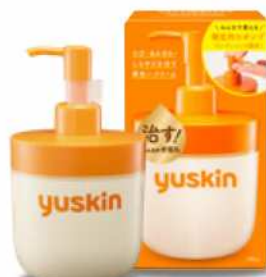
ユースキン 180g ポンプ