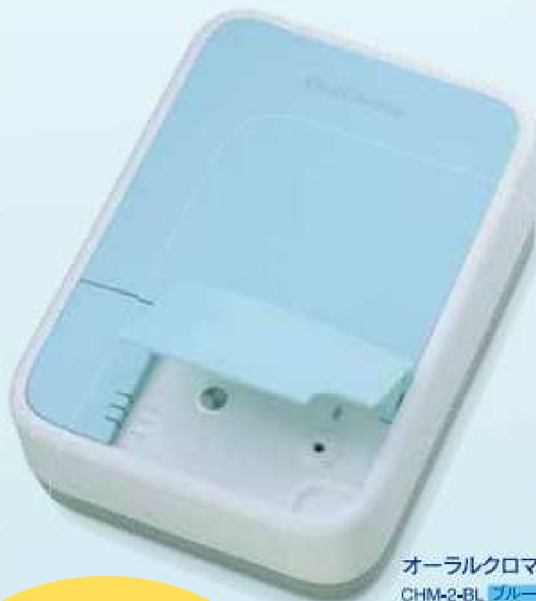
オーラルクロマ CHM-2-BL ブルー CHM-2-PK ピンク